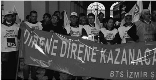
İzmir de olduğu gibi Türkiye'nin her yanında Demiryolcular Dayanışma Grevi ile birbirine kenetlendi