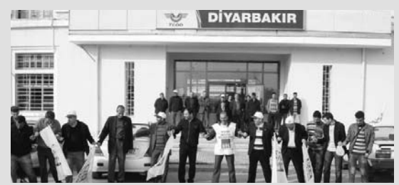
Grevdeki Demiryolcular Diyarbakır Garda Halay Çekerek Eylemlerini Sürdürdüler

Haydarpaşa Garından çıkması gereken Eskişehir Ekspresi ve Doğu Ekspresi çıkarılmadı. Haydarpaşa-Adapazarı arasından çalışan Bölgesel Yolcu Trenleri çalıştırılmamıştır.