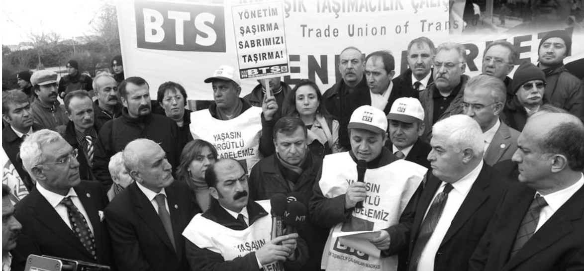
TBMM Önünde Yapılan Basın Açıklaması

Ulaştırma Bakanlığı bütçesi görüşülürken Meclis önünde yaptığımız basın açıklamasına; siyasi parti temsilcileri, KESK'e bağlı Sendikaların Genel Başkanları ve MYK üyeleri, Ankara Şubeler Platformu ve Emek Dostları katılarak sendikamıza destek verdiler.