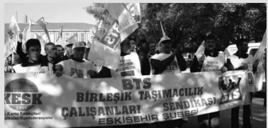
Eskişehir Şubemizden 25 Kasım Görüntüsü

Sabah başlaması gereken Ankara (Sincan-Kayaş), İstanbul (Sirkeci-Halkalı ve Haydarpaşa-Gebze) banliyö seferleri grev nedeniyle başlayamadı.