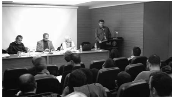
Başkanlar Kurulumuz Toplantı Esnasında

Konfederasyonumuz KESK ve bağlı Sendikalarımızın katılımıyla bir basın açıklaması yapma ve aynı gün için de TCDD Genel Müdürlüğü ile görüşme yapma kararı almıştır.