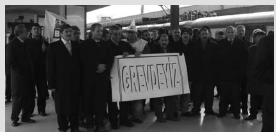
Ankara'da Grevden Bir Görüntü

Karabük'ten Zonguldak yönüne gitmesi gereken Bölgesel Yolcu Treni çıkartılmamıştır.