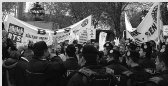
10 Aralık'da Yapılan Basın Açıklamalarıyla Arkadaşlarımızın Görevlerine İadesi Talep Edildi

Uyarı grevimizin özel-likle işkolumuzda en yüksek katılımı en etkili bir şekilde gerçekleşmesi TCDD yönetiminde çok etkisi, demiryolculara ise duygu patlamasına neden oldu. Her ulaşım emekçisi bu haklı gururdan payını aldı. Grev öncesi teşkilata gönderilen genelgelerin hiçbir işe yaramadığını gören TCDD yönetimi grevden 12 gün sonra 16 arkadaşımızı kendi mevzuatına aykırı bir şekilde görevden uzaklaştırdı.