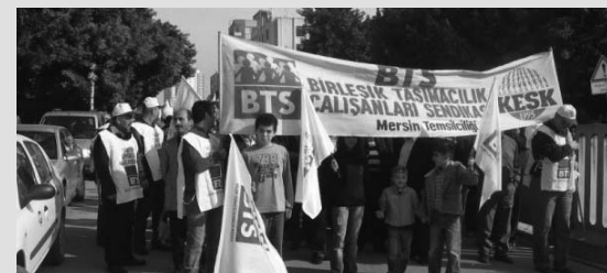
Mersin'de Demiryolcular Aileleriyle Birlikte Grev Coşkusu Mitingle Taçlandılar

Kars'ta; Akyaka Bölgesel Yolcu Treni ile Doğu Ekspresi çıkarılmamıştır.