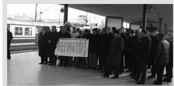
BTS ve TUS Yöneticileri Ankara Gar'ında Demiryolcularla

Tren Kondüktörsüz olarak çalıştı. Tren Eskişehir'de kaldı. Yolcular otobüslerle devam ettirildi.