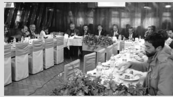
15 Aralık günü yapılan basın toplantısında hukuksuz uygulamalarında direnen TCDD Yönetimine son kez çağrı yapıldı

Arkadaşlarımızın görevlerine iade edilmeleri ve so- ruşturmaların durdurulması için BTS ve Türk Ulaşım Sen Genel Merkezleri olarak 15 Aralık 2009 Salı günü Saat: 10.30'te Ankara Gar'da bulunan bulunan Vagon Resta-