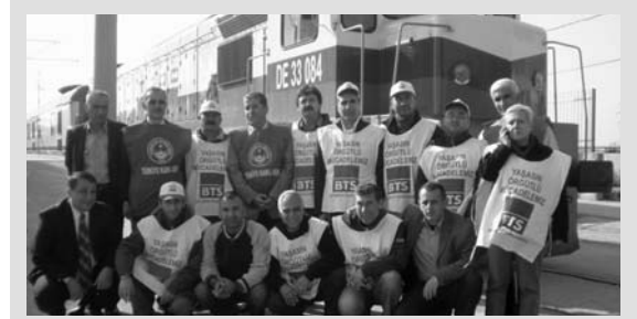
İzmir'de Grevden Bir Görüntü

Meram Ekspresi Kütahya'dan polis tarafından getirilen makinistler marifetiyle yürütülmüştür. Diğer trenler ise bekletilmiştir.