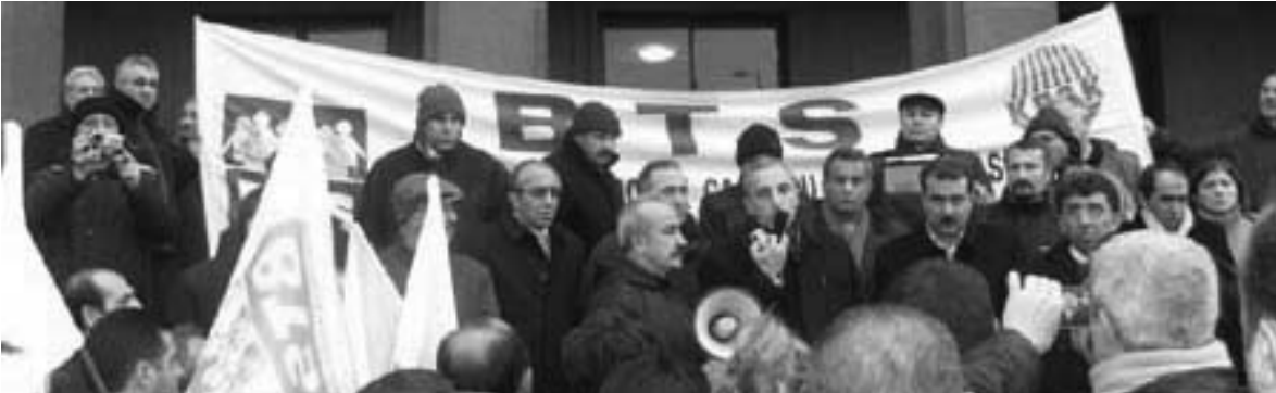
TCDD Genel Müdürlüğü önünde KESK ve bağlı sendika üye yöneticilerinin de katıldığı basın açıklaması

Bu iki grev bir kez daha ancak ve ancak mücadele edilerek sonuç alınacağına ortaya koymuştur.