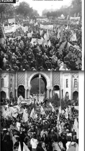
Sendika temsilcileri bir günlük uyarı eylemine katılımın yoğun olduğunu söyledi.

YOLCULAR 2 KM YÜRÜDÜ Zonguldak'tan hareket eden yolcu treni, memurların "Uyarı Grevi" sebebiyle Karabük'e 2 kilometre kala durdu. Makinist, yola devam etmeyince yolcuları yarı olarak istasyona ulaştı. Bazı yolcular ise trende beklemeyi tercih etti.