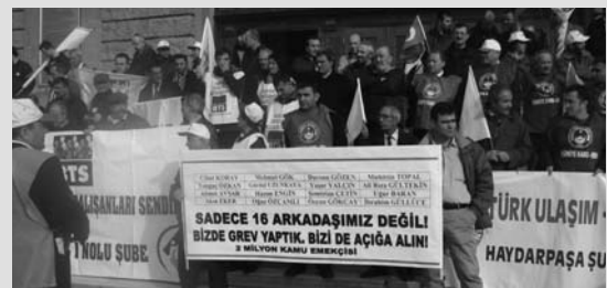
10 Aralık'da İstanbul'da Yapılan Basın Açıklamasından Görüntü