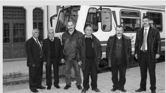
Dayanışma Grevinde Amasya'da trenler çalışmadı

Kurtalan'dan Diyarbakır'a gidecek bölgesel yolcu treni Kurtalan'dan çıkartılmadı.