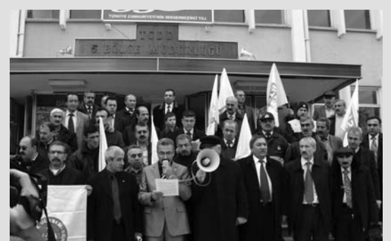
10 Aralık'da Bütün Türkiye'de Yapılan Basın Açıklamalarından Biri de Malatya'da Yapıldı

için birlikte mücadele ettikleri 25 Kasım uyarı grevine katılan arkadaşlarının işlerine dönmesi için canlarını dışlerine takarak grevi başardılar.