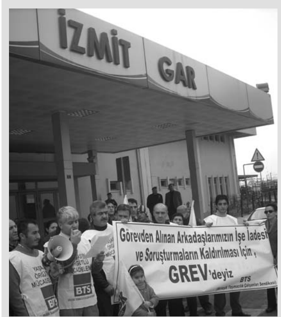
İzmit Gar'da Demiryolcuların Dayanışma Grevini Aileleri Yanlız Bırakmadı

Anadolu, Fatih Ekspresleri trenleri Haydarpaşa'dan çıkarılmadı.