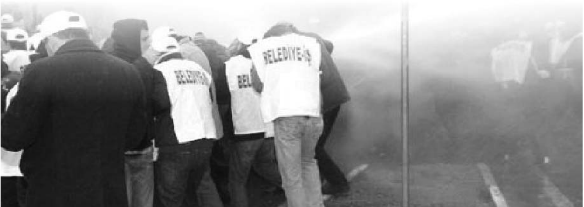
Yine Tekel ve Demiryol Çalışanlarıyla eylemlerini buluşturan İtfaiye İşçileri de şiddetten nasibini aldı

16 Aralık'ta mücadelelerini bizimle birleştiren itfaiye işçilerinin direnişini selamlıyor, onlara yapılan baskı ve şiddeti kınıyoruz.