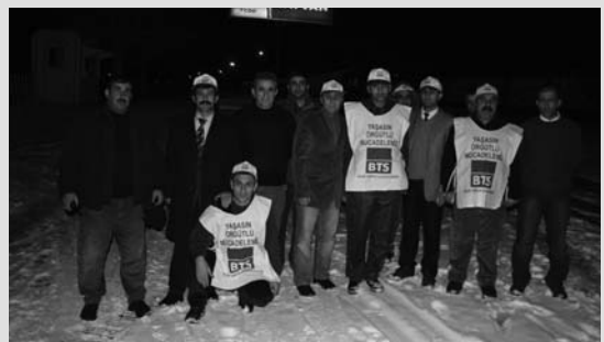
Kara kışa inat Tatvan'da Demiryolcuların yüreği dayanışma grevinin sıcaklığıyla attı!

Muş'ta sendikamız üyeleri iş bıraktılar.