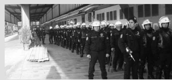
Ankara Garda Polis Adeta Etten Duvar Öreerek Grevcilere Baskı Yaptı

Karabük'ten Zonguldak yönüne gitmesi gereken Bölgesel Yolcu Treni çıkartılmamıştır.