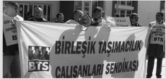
Sivas Garda Basın Açıklamasından Bir Görüntü

Kayseri'den Adana'ya gidecek Erciyes Ekspresi çıkartılmamıştır.