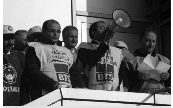
DHMI Çalışanları grev esnasında basın açıklaması yaparken

Saat 12.30'da Beyazıt'ta düzenlenen KESK mitingine katılacak olan DHMI çalışanları, Sirkeci Garı'nda bulunan BTS İstanbul 1 Nolu Şube üyelerini ve grev alanını ziyaret ettiler.