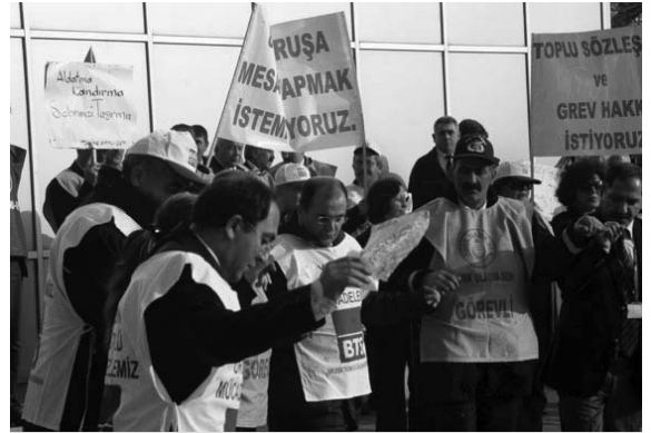
Grevin coşkusu halayla taçlandırırlar