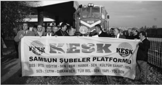
Samsun'da KESK Şubeler Platformu Grev Esnasında Demiryolcuların Yanındaydı

Haydarpaşa Gar'da; Sendikamız İstanbul 1 No.lu Şube Başkanı Hasan BEKTAŞ, İstanbul 1 No.lu Şube üyemiz Ahmet TUNA, Türk Tarım Orman Sen İstanbul Şube Başkanı Okay Yıldırım ve dayanışma için gelen 2 üniversite öğrencisi olmak üzere 5 arkadaşımız gözaltına alındı. Gözaltına alınan arkadaşlarımız ifadelerinin alınmasından sonra serbest bırakıldılar.