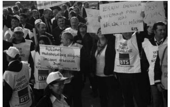
Ve alanlara çıkarak 2 milyon kamu emekçisiyle buluştular