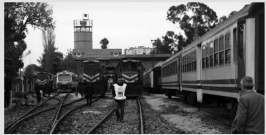
Grev Esnasında 6. Bölgede Hiçbir Tren Çalışmadı

Kayseri'den Adana'ya gidecek Erciyes Ekspresi çıkartılmamıştır.