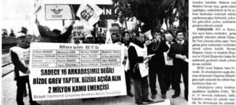
'Uyan grevi'ne katıldıkları için işlerinin uzaklaştırılan 16 işçinin işe iadesi için başlatılan eyleme polis müdahalesi...