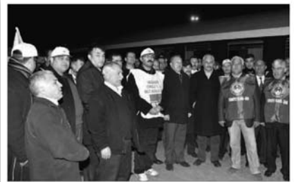
TÜRKİYE Ulajın Hizmet Kolu Kamu Görevlileri Sendikası (Türk Ulajın-Sen) ve Birleşik Taşımacılar Çalıřanları Sendikası (BTS) Adana şubelerinin birliktelikte 16 TCDD çalışanını grevlerine iade etmeye yattığı iş barakası eylemine polis müdahalesi...