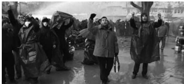
Demiryolcularla aynı gün eylemde buluşan Tekel İşçilerine hükümet gaz bombalarıyla saldırarak gerçek yüzünü gösterdi

Özelleştirme sürecinin sonuçlarına karşı açığa çıkan TEKEL işçilerinin direnişi ve talepleri güncel siyasi tartışmaların perdelediği Türkiye gerçeğine rağmen bugün ülke gündeminde önemli bir noktada.