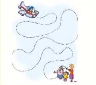
O THY Grevcilerden Bir Kadındır

Birleşik Taşımacılık Çalışanları Sendikası (BTS)