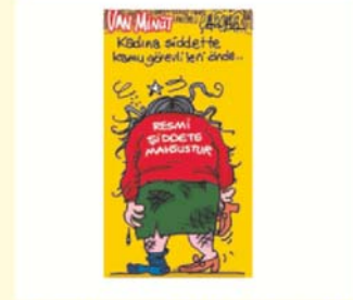
5 Soru 5 Cevapta Kadın Hareketi