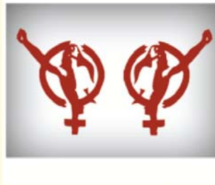
Güçlü Sendikaların Kadınlara İhtiyacı Var!!!