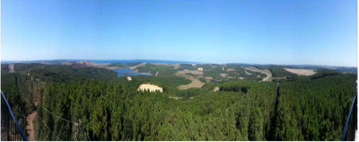
Görsel 2. Üçüncü havalimanı proje alanının panoramik fotoğrafı

Gözlerimle görmeden inanmam diyenler için buyurun size proje alanının panoramik bir fotoğrafı (Görsel 2):