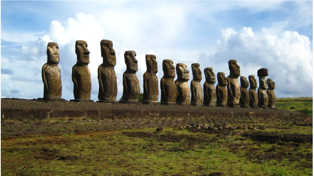
Görsel 4. Paskalya Adası'ndaki Heykeller

Bütün bunları okurken pek çok kişi gibi "Ne var yani? Havalimanı, köprü yapmayacak mıyız? Yapmazsak nasıl büyüyeceğiz?" diye düşünüyor olabilirsiniz. Sizden bir kez daha düşünmenizi rica ediyorum. Düşünürken, bu türden projelerin fırsat maliyetinin çok yüksek olduğunu, üstelik geri dönüşün de mümkün olmadığını unutmayın. Kendinize "3. havalimanı çevreye bu kadar zarar vermeden yapılamaz mıydı?" diye sorun. Sorarken, tıpkı demokrasisine özen göstermeyen toplumlar gibi, doğal çevreye özen göstermeyen toplumların da uzun dönemde sağlık bir şekilde büyümediğini, hatta çöktüğünü de aklınızın bir kenarında tutun lütfen. Gelin size, konuyu bir kez daha düşünmenizi sağlayacak küçük bir hikâyeye anlatayım. Pasifik Okyanusu'nda küçük bir ada olan Paskalya Adası'nın 19 hikâyesi. Elbette ki bu hikâyeden çıkarılacak bazı dersler var.