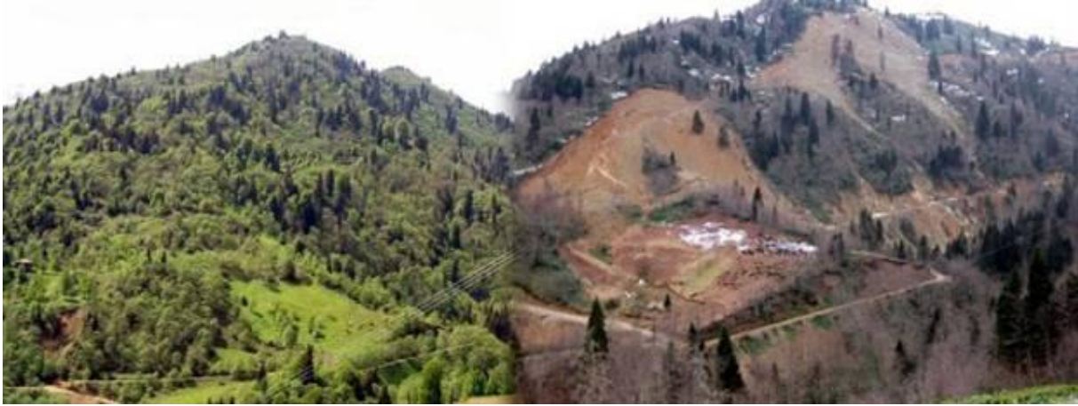
Görsel 5. HES'leri de unutmayalım diye HES Tahribatı Gösteren Bir Fotoğraf

şurayı da yakıp bahçe yapalım, bak şu ağaçlar da güzel yanar, ısınmak için kullanırız falan derken ağaçsız kalan Paskalya Adası'ndan tek farkımız, benzer şeyleri "geniş katımlı paydaş toplantıları" sonucunda modern teknolojiyle yapıyor olmamız olmasın? Eğer 3. Havalimanı illa ki yapılacaksa, bu soruları ve Paskalya Adası'nın hikâyesini aklımızda tutmak için yeni havalimanının adını "İstanbul Son Ağaç Havalimanı" koyalım diyorum. Ne dersiniz?